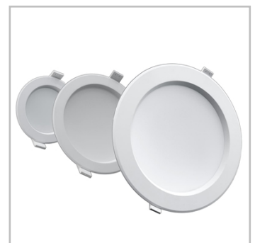
INDU DOWNLIGHT está disponible en 3 tamaños, cada uno con una emisión luminosa típica.