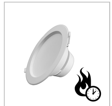
INDU DOWNLIGHT resistente al fuego cumple con las normativas más estrictas de seguridad en interiores.