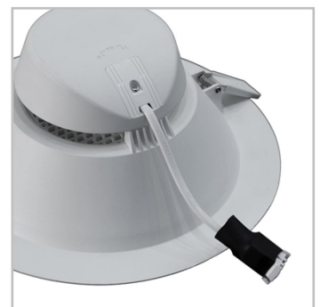
La conexión eléctrica rápida se realiza en la parte posterior de la luminaria.