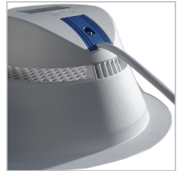
El diseño ofrece una óptima disipación del calor para un rendimiento duradero.

INDU DOWNLIGHT también proporciona un elevado confort visual. Emite una luz blanca neutra con un alto índice de reproducción cromática (CRI 80).